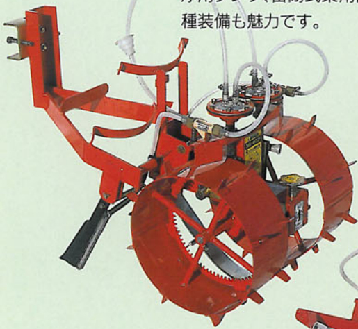
2条ちどり(間欠)注入式 〔ティラー用〕 MI-407