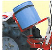
タンクの薬液が少なくなった時はタンクを傾けることができますので、最後まで使用できます。