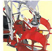
液漏れ防止装置付なので、旋回時の液漏れの心配がありません。