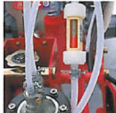
確認計で注入液の確認ができます。