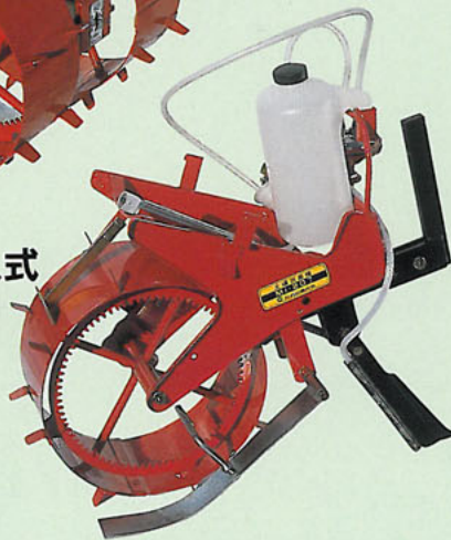
1条間欠注入式 〔ティラー用〕 MI-207