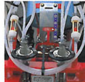
タンク内の液量を確認できる計量装置付です。